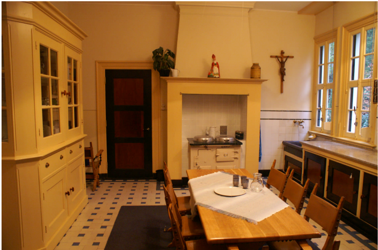
De keuken in het parochiecentrum van de H. Landstichting.

“Als er twee of drie in Mijn Naam bijeen zijn....ben Ik in hun midden”. De wondere werking van de H. Geest blijft juist met jonge mensen zo leuk om te ervaren. We zien u graag op 15 januari!/ Namens de Vormselwerkgroep, Barbara Weiler